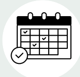
Scheman & bildstöd