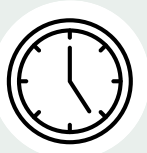
Tidshjälpmedel & tidsramar